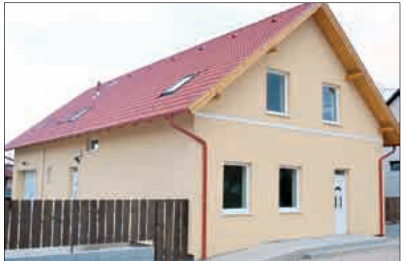
A településüzemeltetési cég és az okmányiroda új épülete

Gyakorlati előkészítése zajlott a megépülő, új szennyvíztisztító mű illetve a teljes vezetékhálózat működtetését biztosító pályázat koncessziós