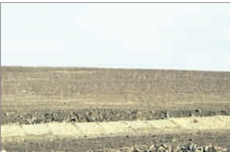
Régen hulladékhegy, most termőföld, és cserjék

Az éves munka tekintetében külön szeretném megköszönni az Otthon Tárnokon Választási Szövetség (OTVSZ) képviselőcsoportjának munkáját, akik a kötelező szakmai-önkormányzati munkán felül megmutatták, mit értünk azon szó alatt, hogy települési képviselő.