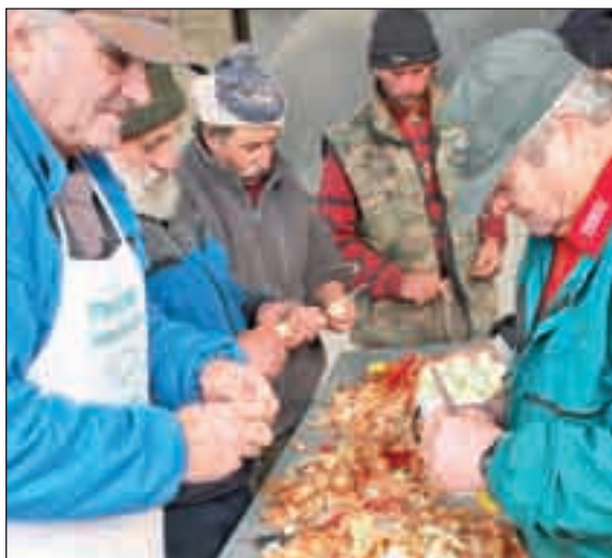
Hagyma előkészítés közben