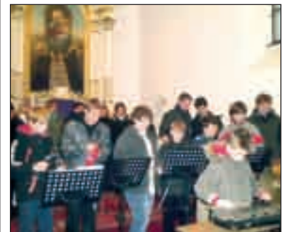
A Tárnoki Ütőegyüttes az Adventi hangversenyen

Szabadlegyen „árulkodnom”. Az ütőhangszeres gyerekek óráin egy újszerű szeretetkapcsolat alakult ki, ennek hatását egy-egy fellépés után egyaránt érezték a gyerekek, szülők, hallgatók és a támogatók.