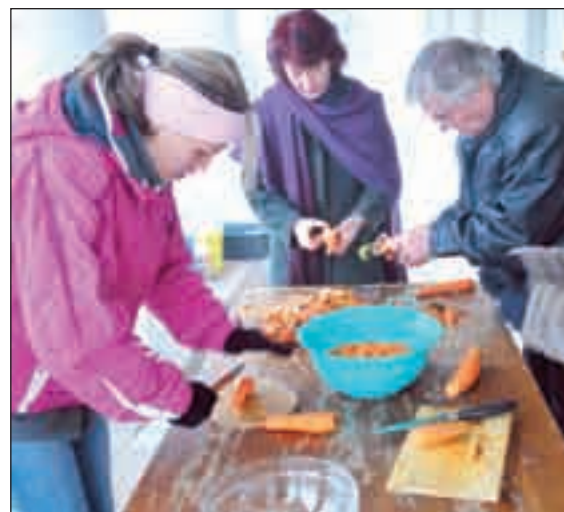
Répapucolás jó hangulatban