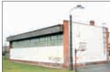
Hamarosan megújul a tornaterem is...

2012-ben a tornaterem épülete is megújul! 14 millió forint jut a komfortosabb környezetre.