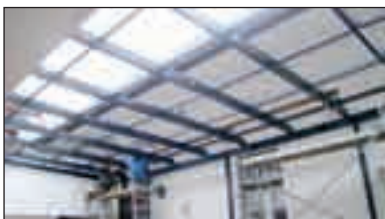
Átrium tető, építés közben

A Művelődési Ház újabb fejlesztéseként korszerű fedél került a belső átrium tetejére az elmúlt napokban.