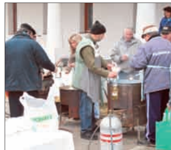
Kész az étel, ebéd van