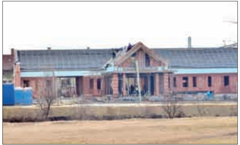
Épül az új vasútállomás is

– Nem közölték az emberekkel a valós számokat. A település intézményeiben ugyanis ezen kívül 17 millió forint jutalmat oszthattunk szét. Ráadásul mindegyik esetében az adott intézmények bérmaradványából fedezték azt. Jó, takarékos bérgazdálkodással az év végére olyan maradványkeret keletkezett, ami lehetőséget adott többletmunka díjazására. Ez tehát az önkormányzat költségvetésének további terhet nem jelentett. Polgármesterként az intézményvezetőinknek engedélyeztem, hogy a keletkezett bérmaradványt jutalomra fordíthassák, ez bruttó 15,4 millió forintot jelentett. Ezt növelte egy testületi döntés további bruttó 1,6 millió forinttal, így összességében bruttó 17 millió forint jutalmat oszthattak szét intézményeinkben. A bérmaradvány az adott pénzügyi évben bérezésen kívül másra nem fordítható, más célra nem csoportosítható át. A gazdasági válság önkormányzatunkat sem kerüli el, de amíg megtehetjük, ilyen eszközökkel is segíteni kell