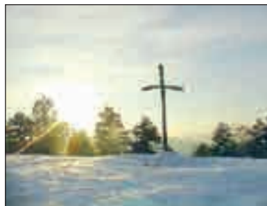
Pieter Bruegel: Farsang és Böjt harca. 1559.