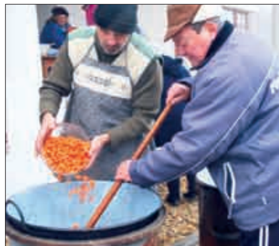
Készül a finom gulyás