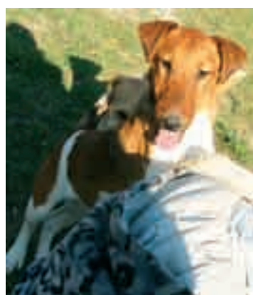
Dinamit: 5 hónapos foxi fiúcska. Nagyon eleven, örökmozgó, sok foglalkozást igényel.

Közzétennénk néhány Tárnokon talált kutya fotóját, annak reményében, hogy az ünnepeket már Ők is családi környezetben tölthetik! Mellettük rengeteg más cica és kutyus várja, hogy gondoskodó gazdára találjon. Elérhetőségük megtalálható az interneten, de személyesen is várják a befogadó gazdik a telephelyükön.