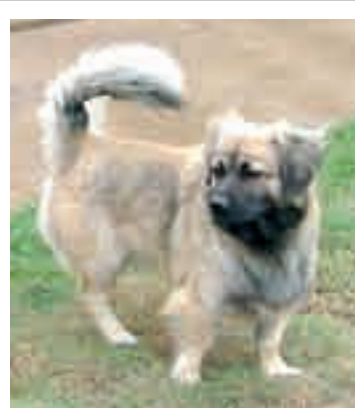
Monti: Tárnokon kóborolt életveszélyes helyen, a Sósúti út mellett. Kedves, kistestű kan.