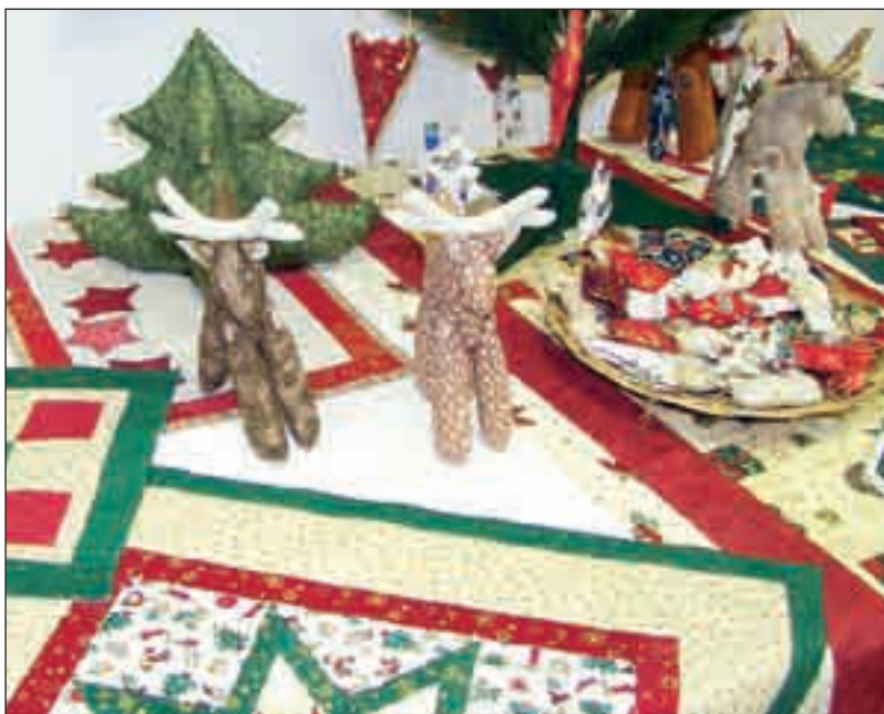
Pillanatkép a Tárnoki Foltoskodók kiállítási műveiből

A Tárnoki Művelődési Házban 2011. november 25-én megtartottuk az év első és egyben utolsó Művész Kávézóját. Sok kétely előzte meg a rendezvényt. Eljönnek-e egyáltalán az emberek? Emlékeznek-e még, hogy mi is a Művész Kávézó, hisz oly régen, még 2010 tavaszán volt az utolsó, amikor még a régi Művelődési Ház állt. Vajon mindenre gondoltunk? A kis csapat zsongott, mint a hangyaboly a rendezvény napján, de rá kellett jönnünk, hogy