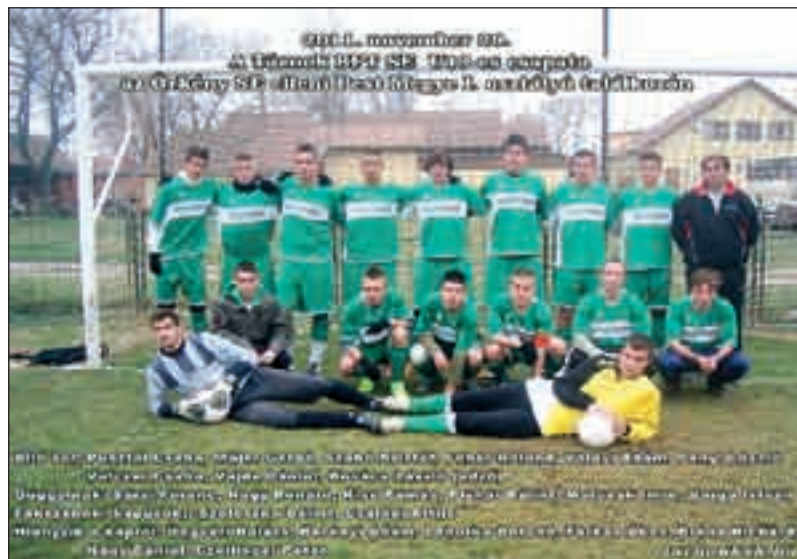
A Bolha Focitanoda U-19-es őszi bajnok csapata

akik egész ügyesen kergetik a labdát és még az edzésekre is eljárogatnak! Bátran kijelenthetjük, hogy egy tudatos és hosszú távra felépített terv egyik állomásához értünk, melyet már megelőztek hasonló sikerek, és ezek következménye a mostani első hely! A program lehetőséget nyújt sportolóink számára, hogy kihozzák magukból a maximumot, de kénytelenek arra, hogy minden a megfelelő időben történjen, és ne sietessük a dolgokat. Borzasztóan nagy ilyenkor az edző felelőssége is! Mikor, mit és mennyit kíván a játékosaitól? Helyesen méri-e fel, mekkora az a súly, amit a fiatal futballistákra enged nehezíteni? El tudják-e ezt viselni, néhanem felülmúlni, néha önmagukat! Ők képesek voltak erre, és nem mindig azzal, hogy ügyesebbek, képzetebbek! Valami mással, azzal a bizonyos mentális erővel! A lelki erővel. Fejben voltak jobbak, erősebbek és nem csak