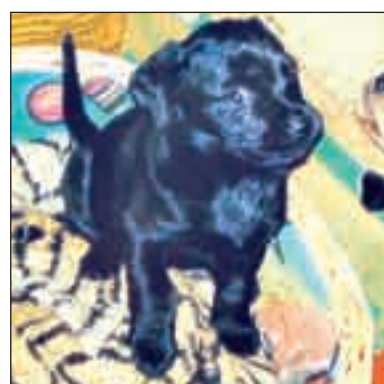
Gondoskodó család jelentkezését várjuk a 23/389-144-es telefonszámon.

Jönnek az ünnepek, az állatok is megérdemlik a körültekintő gondos-