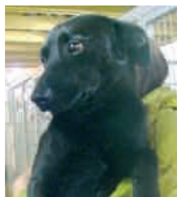
Tucci: Kedves, kicsit félénk, mozgékony taci keverék kan, 1 év körüli. Elég sovány állapotban került a gondozásunkba.