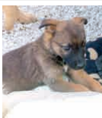
Kisfüles: egy kertbe dobták be lelketlenül, 2 hónap körüli szukakölyök. Maximum kis-közepesre nő.