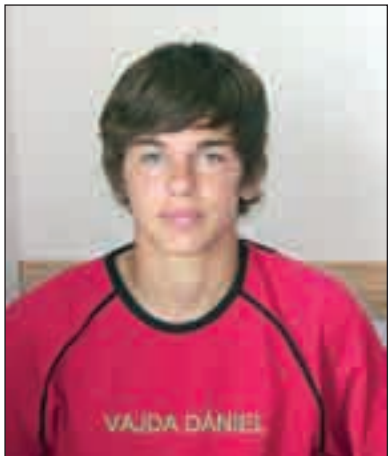
A gólkirály (24. gól)

„A játék alatt tanítja meg a sport az embert rövid idő alatt a legfontosabb polgári erényekre: az összetartásra, az önfeláldozásra, az egyéni érdekek alárendelésére, a kitartásra, tettekre és mindenekelőtt a fair play, a nemes küzdelem szabályaira. Aki ezeket tudja... meg fogja állni a helyét az életben!.. (Szent-Györgyi Albert)