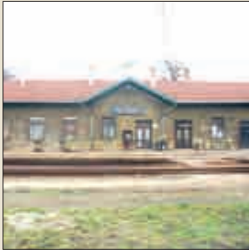
Retro vasútállomás, már nem sokáig...

mert a lerakódott iszap eltávolításával jelentősen javult a vízszállítás és a vízminőség is. A kotrás során sok hulladéktól is megszabadult a meder. Ezzel pedig jelentős környezetvédelmi munka is megvalósult a Benta-patakon, amire pedig az elmúlt évtizedekben nem volt példa.