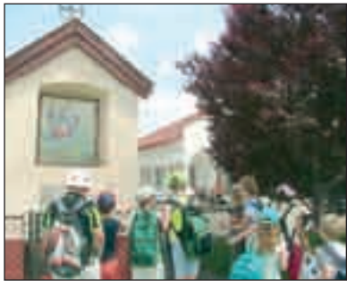
Múlt és jelen találkozása a településismereti versenyen

A Zrínyis Bakancsosok Tárnoki Szakosztálya számára az elmúlt egy hónap elsősorban Tárnok megismeréséről, megismertetéséről szólt. Egyesületünk benevezett a Természetjáró Fiatalok Szövetsége országos versenyére. Ennek egyik állomásaként az indulóknak saját régiójuk nevezetes ütközetét kellett bemutatniuk vizuális eszközökkel. Mi az Arany János által megénekelte Tárnok-völgyi-csatát választottuk.