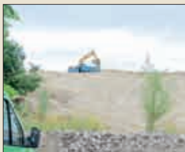
Folynak a rekultiváció munkálatai...

Az új rendőrfőkapitány személyében nyitott, egyenes, határozott embert ismerhettem meg.