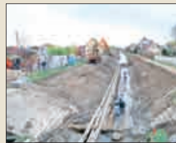
Benta meder rekonstrukció közben...

és Amúr utca közötti területen kivágandó, szám szerint 14 db akácfa közül 6 db egyértelműen kiszáradt, halott és életveszélyes fa, melyek gallyazásáról, kivágásáról ennek észlelése után intézkednünk kellett. De a részletes kivitelezési adatokból megismerhették az érdeklődők azt is, hogy a szeméttelép rekultivációja során termőfölddel borítják be a vízzáró agyagréteget majd ültetésre kerül több, mint 16 ezer db fa, több mint 50 ezer db cserje, és kialakításra kerül 68 ezer négyzetméter gyeplülett. A munkák befejezésével egy szegényfoltból ékköve válik a településrésznek. Egyébként minden fa kivágása – legyen az ok vagy éppen ok nélküli – szomorúságot okoz számomra, de javasolom az országban, a világon a jelenlegi beruházást vizsgálva a tárnoki arányok alkalmazását a kivágott és a telepített fák számának tekintetében. A lakosság kérésére pedig abban is megállapodtunk, hogy az árok kialakítása után még azon a területen is sor kerül faültetésre a kialakuló hely és lehetőségek szerint.