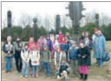
A Mohácsi Történelmi Emlékparkban