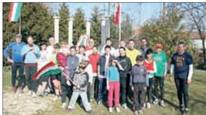
Népes futócsapat gyűlt össze a nemzeti ünnepen

Gyönyörű időre ébredtek azok, akik viszonylag korán keltek ezen az ünnepnapon. Tették ezt azért, hogy közösen, zászlókkal, kokárdákkal ruházatukon körbefussák Tárnokot. Most nem a gyorsaság vagy edzettség volt a főszerep, mert gyerek-felnőtt-fiatal és idősebb is együtt, nagyjából egykupacban futott. Hiszen pont ez volt ezen a napon a lényeg: az összetartozás kifejezése. Öszintén szólva én magam is meglepődtem, hogy mennyien gyűltünk össze! És remélem, a következő ilyen futáson még többen leszünk! Ez az esemény egyben pontszerzési lehetőség volt azoknak, akik már bekapcsolódtak a Tárnoki Hendikep futószorozatba.