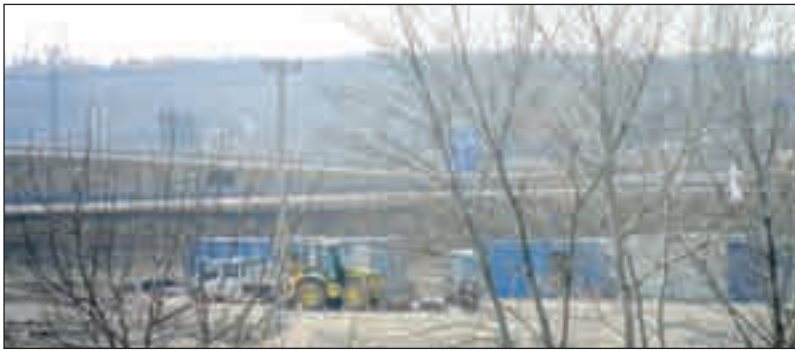
Az M6-os melletti munkaterület

Elkezdődött a kivitelezés az érdi tisztítótelepen. A nyertes uniós pályázat keretén belül megvalósuló csatornaberuházás egyik része – a csatornahálózat teljes kiépítése mellett – az érdi szennyvíztisztító bővítése. A tisztítótelepet üzemeltető ÉTV Kft. és a kivitelezők, valamint a tervező képviselői már el is kezdték a közös munkát. A közel egy évig tartó munkálatok során a tisztítótelep működtetését folyamatosan biztosítani kell, ezért összehangolt munka szükséges. Először megépítik az új teleprész. A jelenlegi telepre befolyó szennyvizet ezután átkormányozzák az új teleprészre, majd következik a régi teleprész felújítása és bővítése. A tervek szerint