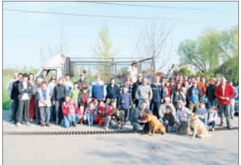
Civil szervezetek önkéntesei a tavalyi települési nagytakarítási akciónap reggelén

A második kritika volt tehát az, amivel meg kellett küzdenünk, de ez rövid küzdelem volt. A politikai kalandorok ugyan morogtak egy darabig, de a sorra alakuló egyesületek saját maguk láthatták meg, hogy a támogatás az valóban támogatás. Ezzel is magyarázható a számuk dinamikus növekedése. Önkormányzatunk nem kért beleszólási lehetőséget az egyesületek ügyeibe, egyetlen alapvető feltételnek kellett és kell megfelelni: el kell számolni a támogatásokkal. Az idő azonban halad, a tárnoki egyesületek, a tárnoki önkor-