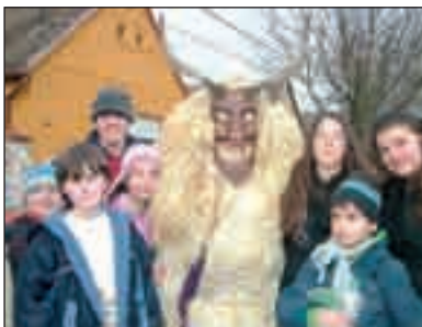
A busókkal együtt üztük el a telet!

Bakancsos szakosztályunk túráin az „Őseink nyomán” túrazogalom keretében a Zrínyi Miklós életútját követő túrafüzet feladatait teljesítjük. Március 6-án Dunaföldvár volt első állomásunk. Itt megtekintettük a Törökrotony épületét, ahol a mohácsi csata után Szulejmán szultán fogadta Buda város tanácsát, s átvette a város kulcsait. Emlékszalagot helyeztünk el Magyar László, földrajzi utazó szobránál.